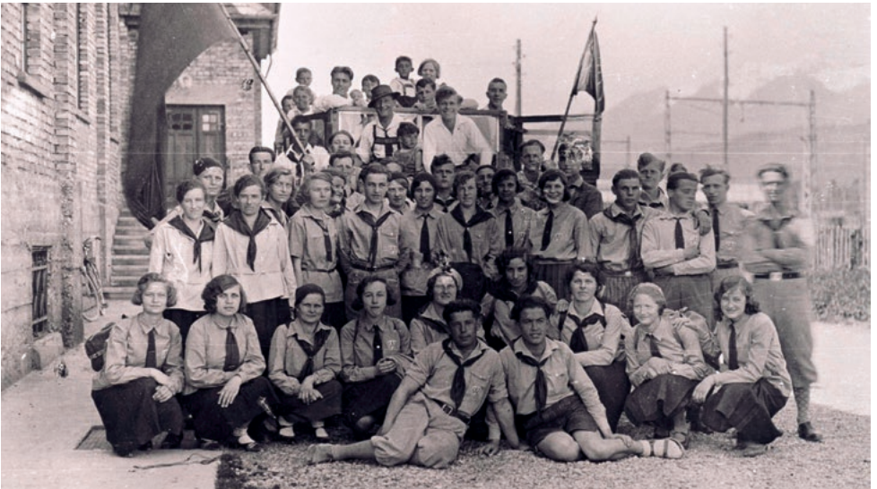
Sozialistisches Jugendtreffen in Bludenz

Ausstellungsdauer: 31. Juli bis 6. September 2026